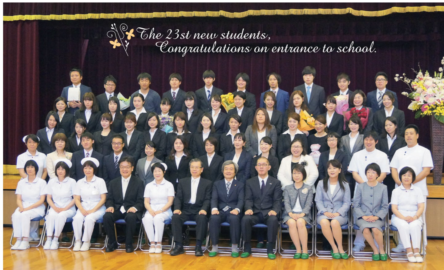
The 23rd new students, Congratulations on entrance to school.

〈編集・発行〉 ソワニエ看護専門学校 〒703-8265 岡山市中区倉田394-3 電話(086)274-6455 ホームページ: http://www.soigner-nc.jp E-mail:info@soigner-nc.jp 〈発行責任者〉安岡満利子